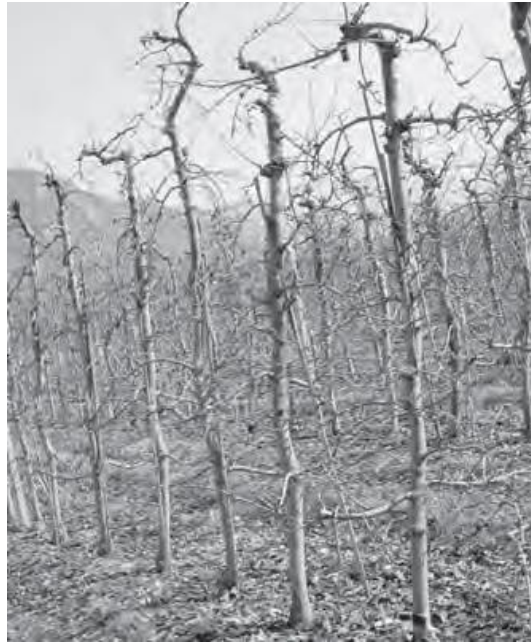
图 5 成龄的高纺锤形树有一个主心干，但无永久性侧枝。 长势旺盛的侧枝被去掉，只在树干上留下直径较小的结果枝