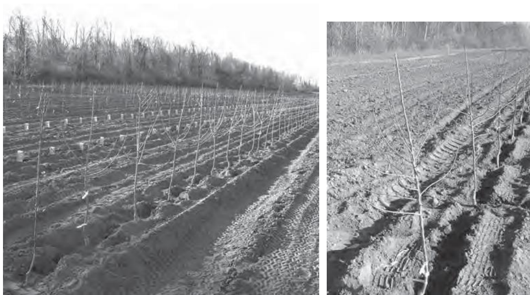
图 1 高纺锤形果园采用多分支的大苗，行内距 3 英尺

黄元帅 (Golden Delicious) 等等，我们建议使用 90 厘米的行内距 (图 1)。对于长势较旺的品种，例如旭 (McIntosh)，斯巴坦 (Spartan)，富士 (Fuji)，乔纳金 (Jonagold)，陆奥 (Mutsu) 等，以及在枝端结果的品种，如考特兰 (Cortland)，罗马 (Rome)，澳州青苹果 (Granny Smith) 和姜黄金 (Gingergold)，我们建议使用 1.2 米的行距。行间距在坡上应采用 3.6~3.9 米，在平面上应采用 3.0~3.3 米。高纺锤形果园采用多分枝的大苗，行内距 90 厘米，如图 1 所示。