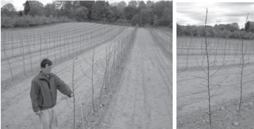
图 2 纽约州使用多分枝大苗（多于 15 个分枝）的幼龄高纺锤形果园（3 英寸×12 英寸）。注意栽植时树高为 6 英尺。1 英尺 = 30 cm

米；有 10~15 个布局合理、长度不超过 30 厘米的侧枝；最底部的侧枝与地面的距离不要小于 80 厘米，如图 2 所示。通常而言，北美地区生产的苗木没有这么多的侧枝。但是近两年，一些苗圃开始生产多分枝的大苗。许多苗木有 3~5 个长侧枝而不是 10 个短侧枝，这需要加强对侧枝的管理。