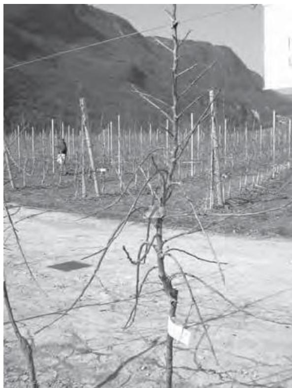
图 3 多分枝大苗的大的侧枝都被绑缚到水平线以下

可以使高纺锤形这一密集的系统多个侧枝长期结果，并避免在头 5~8 年进行大量的修剪。