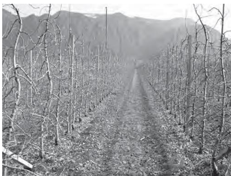
图 4 幼龄高纺锤形果园的树干有支撑，树冠呈圆柱形，没有永久性侧枝。

侧枝在栽植时或是第一年的夏季，需要被绑缚至水平线以下以诱导结果并控制树冠的宽度（见图 3）。头几年对主干的延长枝通过篱架给与支撑，并且不短截，直到第四、第五年树高达到期望的成熟树的高度，并且开始大量结果才回缩。树的顶端是由小的结果枝构成的，它们也由于果实的重压下弯到水平线以下。高纺锤形狭长的树冠使得大部分的树冠有良好的光照，从而保证了果实的质量。