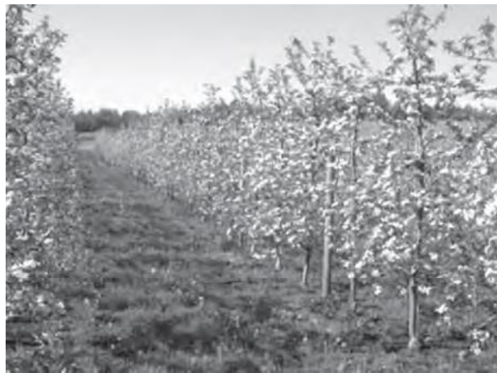
图 6 纽约州的一个成龄高纺锤形嘎啦果园