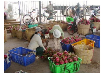
GAP 保证消费者有安全的健康的高质量的食物。